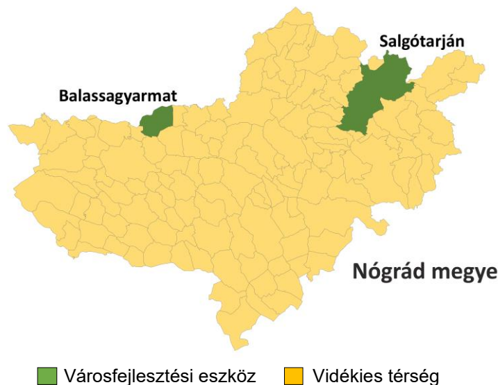
3. ÁBRA: KIJELELT FEJLESZTÉSI CÉLTERÜLETEK

A kijelölt fejlesztési célterületeket az alábbi térkép mutatja be: